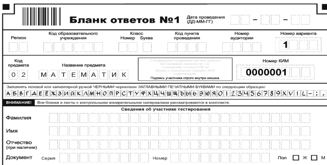
Рисунок 1. Регистрационная часть бланка № 1