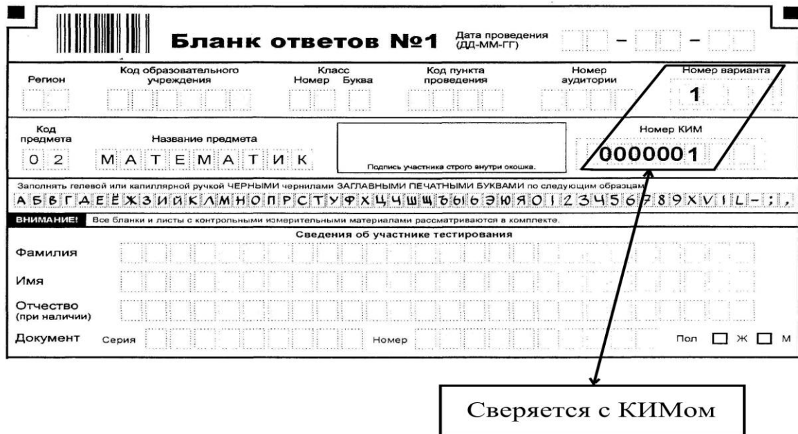
Рисунок 2. Регистрационная часть бланка № 1

3. Участник экзамена ЗАПОЛНЯЕТ в верхней части бланка ответов № 1 ЗАГЛАВНЫМИ ПЕЧАТНЫМИ БУКВАМИ следующие поля: